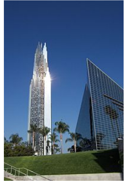
вежа Кришталевого собору в м. Гарден Гроув, арх. Ф. Джонсон, 1980 р., Лос Анжелес.