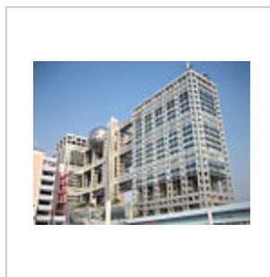
Штаб-квартира Fuji TV, арх. Кендзо Танге, хай-тек.