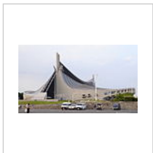
Олімпійський центр в Токіо (1964), Йойоґі.

Навернення Танге до хай-теку логічне, бо в японській будівельній традиції висока функціональність, де використовують кожний квадратний дециметр площі. Танге автор штаб-квартири Fujis Television у 1996 р., що зовні нагадує будинок з дитячого конструктора. Висока образність і поетичність споруд Йойоґі залишилась далеко позаду.